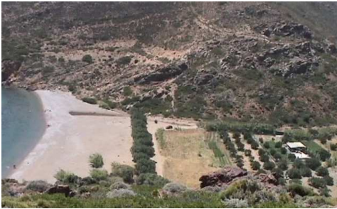
Une rangée de tamaris parallèle au rivage de la plage de Maridati