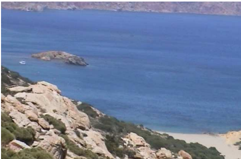
Un petit îlot rocheux au pied d'une pente abrupte et caillouteuse et un arrière plage de sable blond.