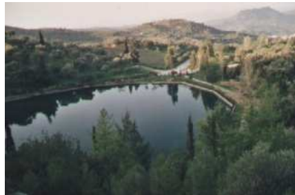
Vue du lac de Votonas