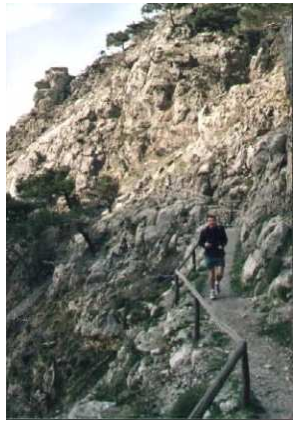
Une partie du chemin aménagé.