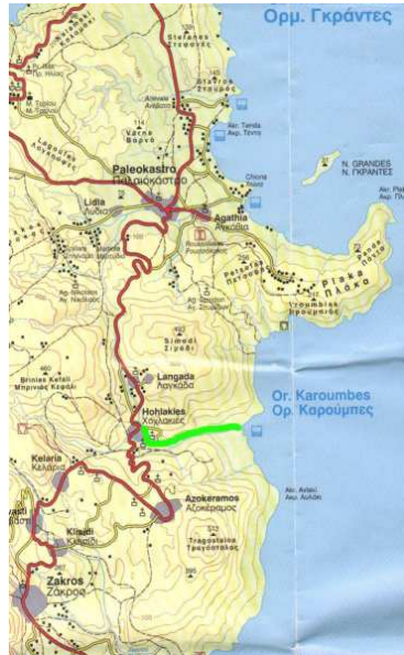
L'arrivée vers la mer.