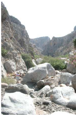
Le lit de la rivière confondu avec le chemin