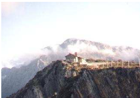
Vue sur le massif des Lefka Ori.