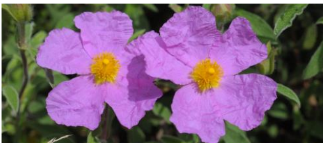
Ciste de Crète

Le ciste de Crète grâce à ses fleurs couleur rose qui ont toujours l'air un peu « froissé » est facile à reconnaître. On attribue depuis la nuit des temps des vertus thérapeutiques 3 à la résine sécrétée par les glandes des feuilles. Pour la recueillir, on froissait autrefois les plantes avec des courroies en cuir.