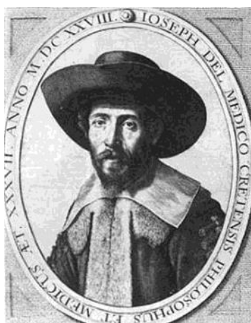
Joseph Del Medigo (1591-1655)

un tiers des récoltes sont versées à l'état. C'est la ruine pour beaucoup d'entre eux, ce qui les conduit à recourir au crédit à des taux souvent très élevés auprès des banquiers israélites. Beaucoup hypothèquent même leurs propriétés. Pour remédier au mal le Sénat de Venise finit par régler les opérations de prêt en réduisant les intérêts ou en établissant des délais de remboursement. Les juifs sont très conscients des services qu'ils rendent à la République et ils osent protester, à plusieurs reprises, devant le Sénat de Venise contre le poids abusif des impôts et le non remboursement des prêts. Ils sont parfois entendus par les autorités qui leur sont redevables, certaines taxes sont revues à la baisse et des conventions de remboursement sont établies. La république, lucide sur sa dépendance, va même jusqu'à les protéger et les défendre, si besoin, lors de leurs transactions à l'étranger comme ils le font pour leurs propres