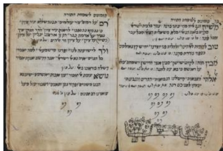
Manuscrit d'un piyyutim (po eme liturgique) romaniote Collection de la Biblioth eque nationale d'Isra el

Pour les premiers si cles de notre  re, les informations concernant les juifs cr etois sont tr es fragmentaires. Au 1 er si cle, d'apr es le philosophe juif Philon d'Alexandrie 6 , les grandes  les grecques y compris la Cr ete comptent de nombreuses colonies juives; ils prosp erent   Gortyne, Kissamos, La Can ee, R ethymnon, Knossos et Sitia. Socrates Scholasticus 7 nous relate une  trange affaire ayant lieu autour des ann ees 430. "Mo se de Cr ete", messie auto proclam e, persuade les isra elites cr etois qu'il est capable de repousser les flots de la m editerran ee afin de les conduire   pied sec en Terre Sainte. Ces derniers vendent tous leurs biens et se rassemblent le jour "J" en haut d'une falaise et se jettent dans la mer ; l'histoire ne dit pas si ce Mo se de Cr ete saute avec eux ! Mais le miracle n'a pas lieu. Les quelques rescap es de la noyade, sauv es par les curieux venus en bateau assister au prodige se sont, d'apr es la rumeur, convertis instantan ement au christianisme. Pendant la p eriod byzantine jusqu'en 1204 les juifs cr etois prosp erent; ils subissent cependant des pressions les invitant   devenir chr etiens mais sans grand succ es. Ils ne sont plus autoris es   vivre dans l'enceinte fortifi ee des villes, et se regroupent dans des quartiers extra-muros   proximit e