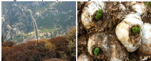
Urginea maritima .: Images : West -crete.com

Dans les phrygas proches de la mer on rencontre souvent la scille maritime ( Urginea maritima ) qu'il convient de ne pas confondre avec l'asphodèle (présente aussi mais beaucoup plus rarement). Ses grandes tiges portant des fleurs blanches dominant le paysage à la fin de l'été. Cette liliacée se développe à partir d'oignon de un à deux kilogrammes qui dépassent en grande partie du sol.