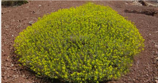
Euphorbia acanthothamnus 4

On trouve bien d'autres espèces végétales telles que