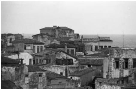
Quartier juif Evraiki de la Canée. Musée juif de Grèce