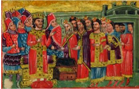
D el egation de rabbins offrant de l'or   Alexandre le Grand habill ee en empereur byzantin miniature du XIV eme si cle

vernaculaire et de communication dans l'Est des territoires, c'est aussi la langue des intellectuels   c ot e du latin. Le 5 eme si cle de notre  re voit la fin de l'empire romain d'occident. L'empire oriental gouvern e   partir de Constantinople perdure jusqu'en 1453, il conserve son appellation: "Empire des romains" 4 . Les nombreux juifs de cet ultime "Empire romain" sont alors baptis es Romaniotes. Ils parlent le grec et le y evanique, dialecte m elangeant le grec et l'h ebreu. Ils utilisent une traduction grecque de la bible: la Septante 5 . Leurs traditions sont particuli eres ainsi que l'organisation de leurs synagogues. Les chants ainsi que la lecture de la Torah sont fortement influenc es par la musique byzantine.