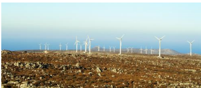
Image typique de paysage crétois, phrygana et éoliennes!

Si vous souhaitez déambuler dans la phrygana, soyez bien chaussés, mettez un pantalon long et n'oubliez pas les gants (type gants pour rosiers) car la phrygana est « piquante ». La présence de ces piquants constitue une excellente protection contre les chèvres et les moutons. Il y a de nombreux reptiles mais aucun ne présente de danger.