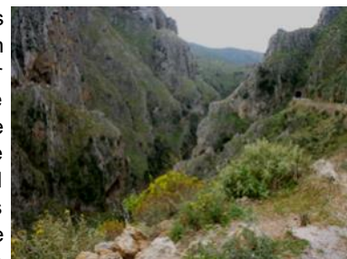
Les gorges de Topolia et le tunnel routier

La plupart des gens qui veulent un jour se rendre à Elafonissi choisissent la route la plus directe qui passe par Topolia. Elle longe les superbes gorges du même nom et pour ceux qui le souhaitent, ils peuvent au passage visiter la grotte d'Agia Sophia. Traverser le village de Topolia n'est pas particulièrement facile, comme la plupart de villages crétois, mais une fois cet obstacle franchi on se heurte à un tunnel excessivement étroit, une seule voie taillé dans la montagne il y a très longtemps; son trafic est régulé par un feu qui permet d'alterner le sens de circulation. Pour fluidifier le flot de véhicules, surtout en été et améliorer la sécurité dans le village tout au long de l'année, un projet de contournement d'une dizaine de kilomètres a vu le jour en 2014. Son achèvement était initialement prévu en 2015. Les nombreuses péripéties qui ont jalonné le parcours de ce projet, arrêt des travaux ou du financement, études géologiques complémentaires, ont repoussé la date d'achèvement qui serait prévue fin 2024! Encore un peu de patience.