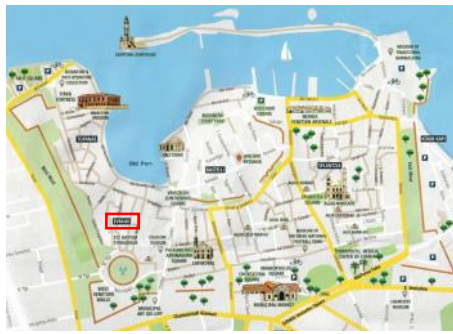
Les quartiers de la vieille ville de La Canée, Topanas, Kastelli, Splantzia, Koum Kapi et Evraiki.