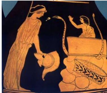
Athéna place Erechthée dans une boîte, avec deux serpents comme gardes.

Minos ressentit la même surprise lorsqu'il entendit des voix provenant de l'intérieur de la tombe. Il la fit ouvrir et de l'intérieur sortirent son fils ressuscité et le devin argien. Les Curètes avaient raison... Le serpent joua un rôle important à l'époque minoenne comme expression des forces chtoniennes, comme expression chtonienne de la divinité, même si on connaît la croyance populaire pour ses relations avec les morts. Dans la mythologie grecque, il conserve des pouvoirs étonnants. Le mythe d'Érechthée, qui semble-t-il est d'origine crétoise, mais aussi le mythe de Glaucos montrent plusieurs caractéristiques particulières du