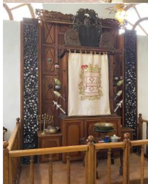
Synagogue Ets Haïm. La Canée Juillet 2023