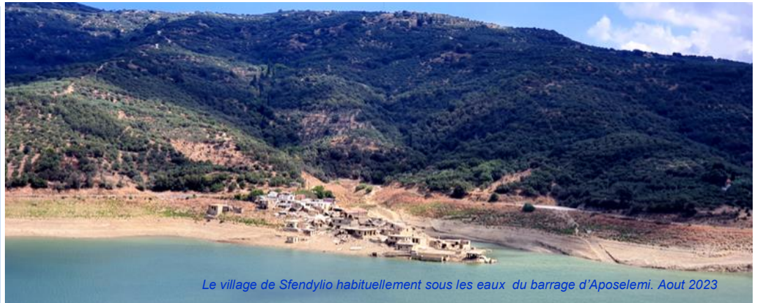
Le village de Sfendylío habituellement sous les eaux du barrage d'Aposelemi. Aout 2023