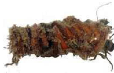
Larve de phrygane

Le mot phrygane désigne également un petit insecte