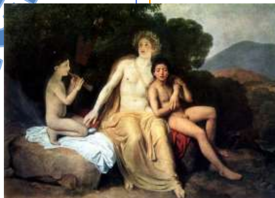
Apollon, Hyacinthe et Cyparissos chantant et jouant. 1834 Ivanov Alexander Andreevich (1806 - 1858)