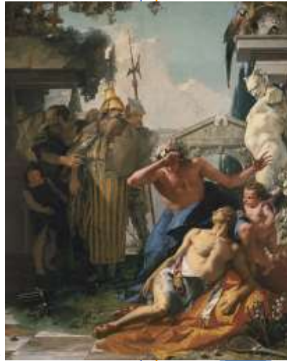
La mort de Hyacinthe.1752-1753 Giovanni Battista Tiepolo (1696 1770)

κόσμο. Φαίνεται πως ήταν σύμβολο και έκφραση της εφηβείας. Γι' αυτό και πίστευαν ότι καθυστερούσε την ενηλικίωση. Οι έμποροι δούλων χρησιμοποιούσαν το άνθος στους εφήβους που πουλούσαν, για να καθυστερήσουν την ενήβωσή των! (Πλίνιος, 11,170, Διοσκουρίδης 4,62).