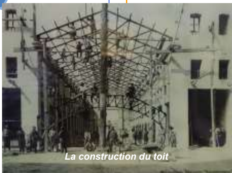
La construction du toit