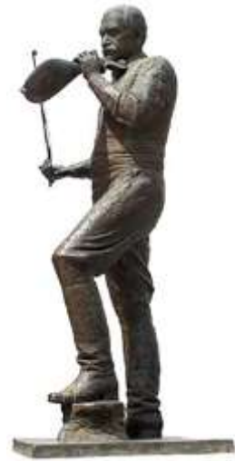
Statue de Kostas Moundakis (1926-1991) place centrale de Rethymnon