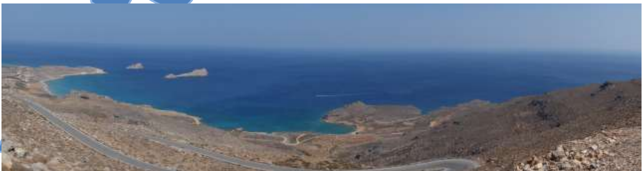
Xerocambos, la route de Ziros