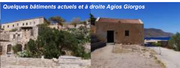
Quelques bâtiments actuels et à droite Agios Giorgos

et pour permettre aux occupants de combattre le sentiment d'enfermement derrière les remparts. Puis