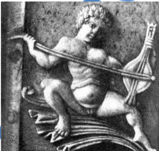
Joueur de lyre byzantin (an 1000 ap. JC). (Musée National de Florence / Le Bargello)

La lyre ancienne ou petite lyre (lyraki) est apparue sur l'île de Crète vers le XVIIème siècle, sous l'influence des Byzantins. La lyraki n'est plus utilisée en Crète, mais elle est toujours présente, dans quelques îles du Dodécanèse, en Macédoine et en Turquie.