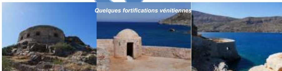
Quelques fortifications vénitiennes

Bressani comportait un mur d'enceinte côtier qui fut construit entre 1579 et 1583. Enfin, en 1588 et 1589 Orsini