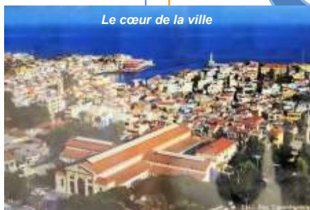
Le cœur de la ville

Le maire Emmanuel Moundakis posa la première pierre du marché le 14/08/1911 et les travaux commencèrent non sans susciter au passage diverses difficultés qui furent heureusement surmontées. Il est à noter qu'après