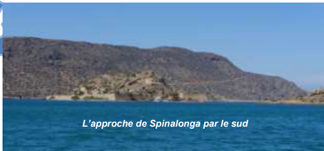
L'approche de Spinalonga par le sud

puis, de chaque côté de la rue, des maisons restaurées proposent des expositions d'ustensiles utilisés à l'époque de la léproserie, et aussi des panneaux retraçant l'histoire de l'île. Peu après, sur la gauche, on découvre l'ancienne porte d'accès en face de Plaka seulement distant de 400m. On peut également apercevoir les citernes destinées au stockage de l'eau potable, puis en poursuivant le chemin on arrive à la pointe nord vers la demi-lune Michieli. En progressant vers le sud, après le pont de bois, on surplombe la côte déchiquetée par les vagues et le vent du large, jusqu'à la petite église d'Agios Giorgos. Un peu plus loin à gauche, un petit escalier donne accès à des sépultures sur le bastion Donato alors qu'à droite une rampe en pente douce accède à la demi-lune Barbariga. Il suffit de descendre vers le bord de mer et d'attendre le bateau qui vous a amené pour rejoindre votre point de départ. Très souvent, pour le trajet de retour, les capitaines des bateaux proposent de faire le tour de l'île, cela permet d'apprécier le caractère imposant des fortifications encore plus impressionnantes de la mer.