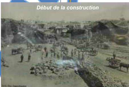
Début de la construction