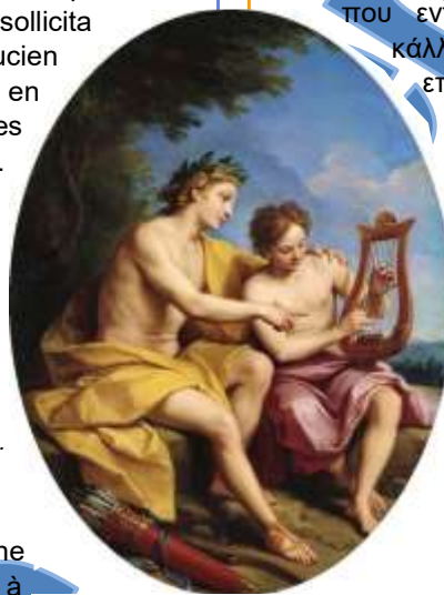
Apollon apprenant à Hyacinthe à jouer de la lyre 1688. Louis de Boullogne, le Jeune. (1654-1732.)

Un jour Apollon et le jeune Hyacinthe lançaient le disque. Tout à coup le vent se mit à souffler en bourrasques, s'empara du disque, le fit heurter un rocher, rebondir et percuter la tête du malheureux Hyacinthe. Le beau jeune homme mourut sur le champ. Apollon ressentit une très profonde douleur de la mort de l'éphèbe, son ami, et décida de rendre son nom éternel et immortel. Comme le sang de Hyacinthe coulait fumant sur la terre, Apollon le changea en une merveilleuse fleur qu'il appela elle-même Hyacinthe (Jacinthe). Les anciens disaient que sur les pétales de la fleur se trouvaient des caractères. Certains discernaient le mot « Ai » qui n'était rien d'autre que l'impression sur la fleur du cri de douleur du dieu et d'autres y voyaient la lettre Y, l'initiale du nom Hyacinthe. Dans le monde antique, cette fleur fut empreinte de connotations symboliques ou même presque magiques. Il semble qu'elle était le symbole