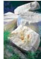
Το τυρί (to turi)