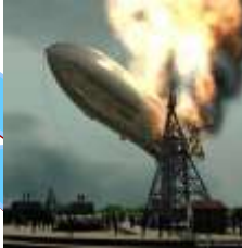
Le 5 est responsable de cette catastrophe.

10. Du grec hydrarguros υδραργυρος et de udôr υδωρ l'eau et arguros αργυρος l'argent. Seul métal argenté liquide, son symbole est associé à l'appellation latine hydrargyrum, qui signifie donc argent liquide. Son utilisation de nos jours est très réglementée. Dans la grille il est désigné sous son