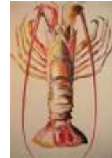
Ο αστακός (o astakos)