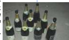
C'est la crise!!!

nir les œuvres de Marc Lévy, Guillaume Musso ou Katherine Pancol, ne résistent pas longtemps au poids de la culture estivale. Petit à petit le papier des pages qu'il ne touche plus se rapproche du visage jusqu'à le toucher, et de ses narines maintenant partiellement obstruées stridule, semblable aux ratées d'un jet ski évoluant près du bord, un vrombissement qui nous rassure. Ce n'est pas une aggravation de sa myopie qui l'oblige à lire d'aussi près, mais il a simplement attaqué une des plus grosses activités de sa journée: la sieste.