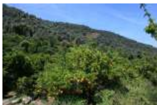
Orangers de la région de Fournes