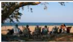
Devant son écran full HD

Quelques brèves apparitions sur l'eau en fin de matinée afin de justifier les modestes investissements de l'année et puis ses muscles et ses articulations, trop sollicités par les manœuvres qu'il répète depuis plus de vingt ans, le contraignent à s'économiser. Armé du dernier roman de l'été, ce n'est pas sans difficulté qu'il se hisse alors dans le hamac tendu pour la sécurité entre deux énormes branches. Fatigués par les efforts qui les laissent jadis intacts, les bras tendus au-dessus de sa tête pour soute-