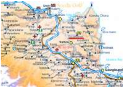
Carte de la région de l'Apokoronas

L'Apokoronas est une région de Crète située sur la côte nord au pied des montagnes blanches entre la baie d'Almyros et la baie de Kalivés. Au cœur de cette région verdoyante, la capitale V a m o s , d o n t l'association parlait déjà il y a dix ans dans