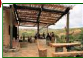
La terrasse de dégustation.