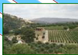
La bâtisse noyée dans les vignes

C'est cette idée séduisante que Nikos Miliarakis a mise en application cet été au cœur du vignoble de Peza. Au détour d'un virage de la route qui serpente dans les vignobles, non loin d'une petite chapelle toute blanche, noyée au sein des vignes, surgit une belle bâtisse en pierres à l'architecture traditionnelle habilement restaurée, avec un mobilier massif des plus rustiques, parfaitement en harmonie avec l'esprit du lieu. Au cœur d'un panorama quasi circulaire sur les grappes qui mûrissent sous vos yeux, accueilli et conseillé par Caspar, suisse allemand, très sympathique, polyglotte installé en Crète, vous voilà dans les meilleures conditions pour apprécier les vins de la cave Minos. Très loin des routes habituelles encombrées et bruyantes, vous serez sans aucun doute séduit par ce lieu situé environ à mi-chemin entre Peza et Kastelli qui mérite une halte sur la route de vos vacances et vous vous souviendrez sûrement de votre dégustation au milieu des cépages Vilana, Malvasia, Kotsifali et autre Mandilari.