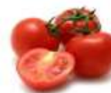
Η ντομάτα (i domata)