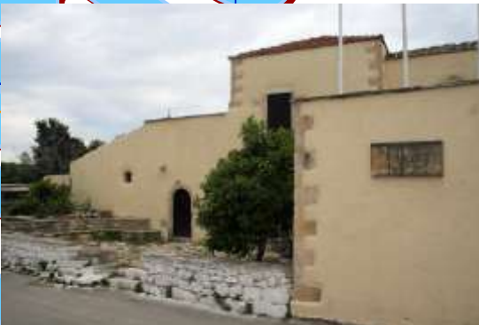
Le bâtiment du musée.