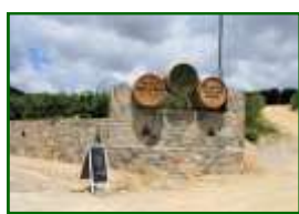
L'accès à partir de la route.