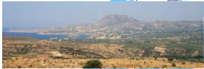
L'Apokoronas vu des environs de Malaxa

son numéro 8 comme le pays du tourisme intelligent, est un gros bourg où l'on continue à restaurer les maisons dans la plus pure tradition. On y trouve aussi les stations balnéaires de Kalivés, Almirida et Georgioupoli. Parmi les nombreux petits villages qui parsèment cette région nous allons plus particulièrement nous intéresser à Gavalochori et à son musée folklorique qui regroupe, dans une ancienne maison au cœur du village, une exposition présentant les activités locales, travail de la pierre et notamment de la soie avec un procédé de confection de dentelle