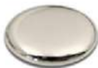
C'est une goutte de 10.

h. De Magnesia: ancienne cité grecque; 2 étymologies impossibles à départager: soit exploitation près de la ville de Magnesia d'un gisement de talc, silicate de ce métal, soit, du latin médiéval "magnesia"(magnésie), dérivé de "magnes lapis" hérité du grec "magnes lithos": pierre d'aimant, en raison d'une ressemblance entre la magnésie noire et les aimants naturels présents en grand nombre dans les environs de cette ville.