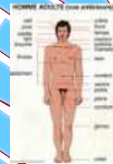
Ο άνθρωπος (o anthropos)