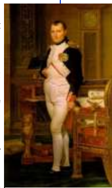
Sa mort est peut être due au 13.