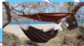
Lieux de culture !!